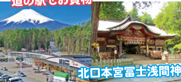
北口本宮富士浅間神社