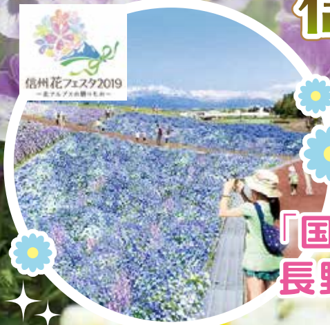
信州花フェスタ2019 — 長野県 佐久市 佐久総合公園 —