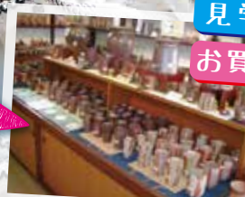
備前焼をお買い物&窯見学