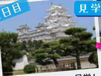
国宝「姫路城」をご見学!