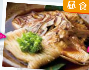
かどや名物!鯛そうめん