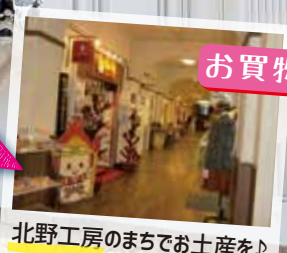
北野工房のまちでお土産を♪