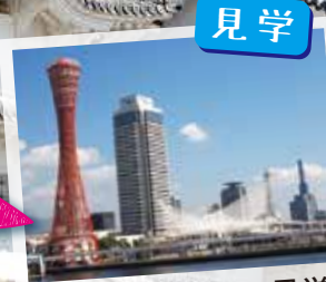
メリケンパーク周辺を見学