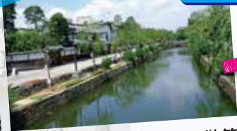
古き情緒!倉敷美観地区を散策