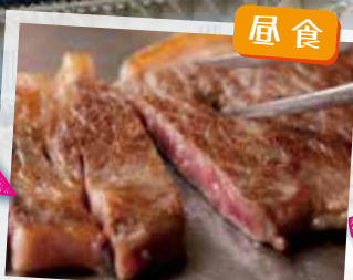
最高品質の神戸牛をご賞味