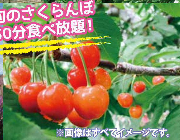
※画像はすべてイメージです。