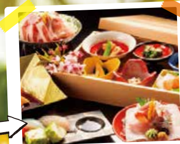
風情ある美食のひとつときを