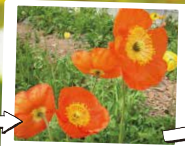
お花摘みをお楽しみ♪