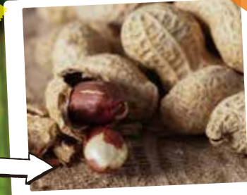
名物落花生のつかみ取り!