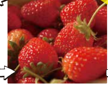
大人気のいちご狩り体験!