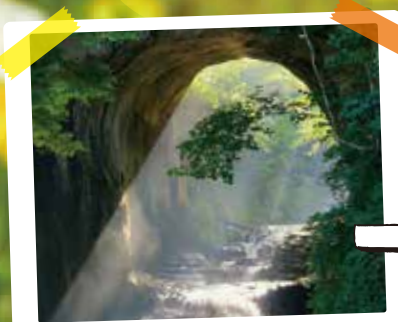
今話題! 濃溝の滝へ!