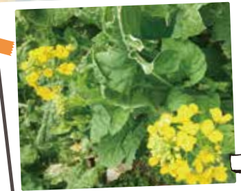
菜の花摘みとレタスお持ち帰り