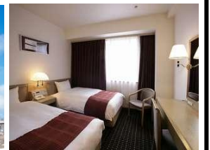
お部屋は洋室1名~2名1室(BT付)をご用意。