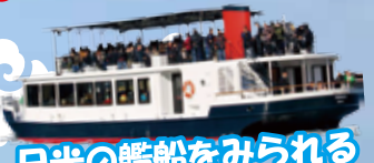
日米の艦船をみられる日本唯一のクルーズ…!