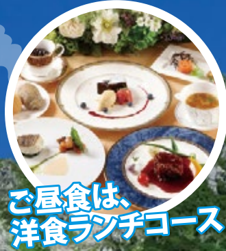
ご昼食は、洋食ランチコース