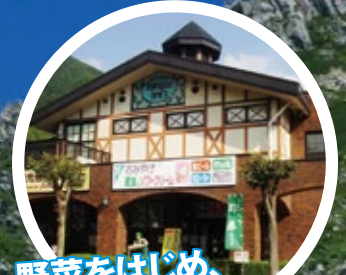
野菜をはじめ、信州のお土産が勢ぞろい!