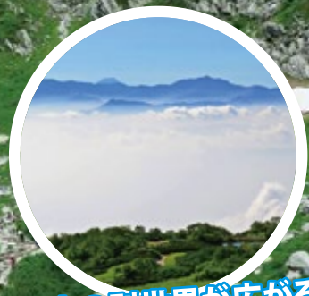
天空の別世界が広がる!