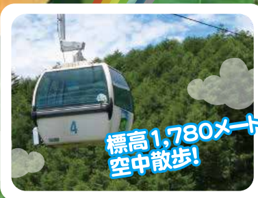
標高1,780メートルの 空中散歩!