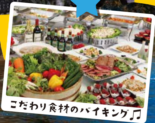
こだわり食材のバイキング♪